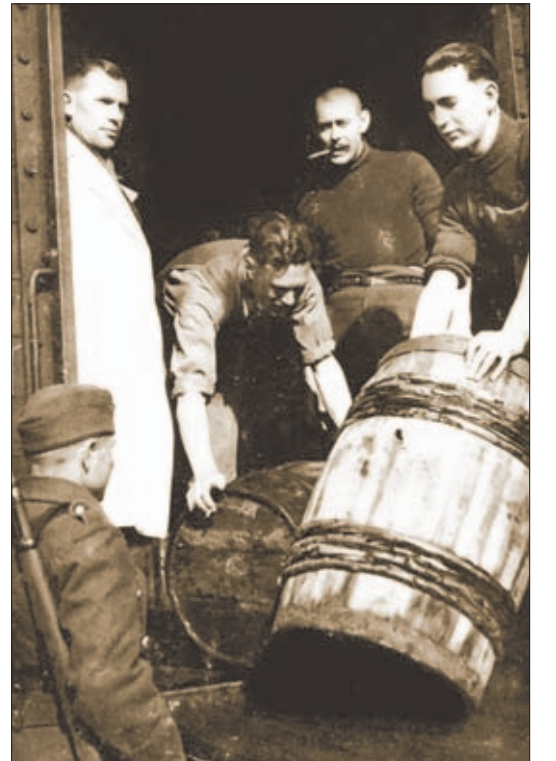
Wer ist der Mann im weißen Kittel? Er arbeitete in der Barther Fischfabrik.

Wer bei der Personensuche helfen kann, melde sich bitte bei der OZ Barth, Lange Straße 13 (Telefon 03 82 31/8 78 82).